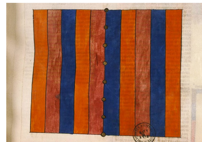
Paris, Bibliothèque Sainte-Geneviève, ms 34, fol. 64

LABORATOIRE DE MÉDIÉVISTIQUE OCCIDENTALE DE PARIS (Université de Paris I—Panthéon-Sorbonne / CNRS)